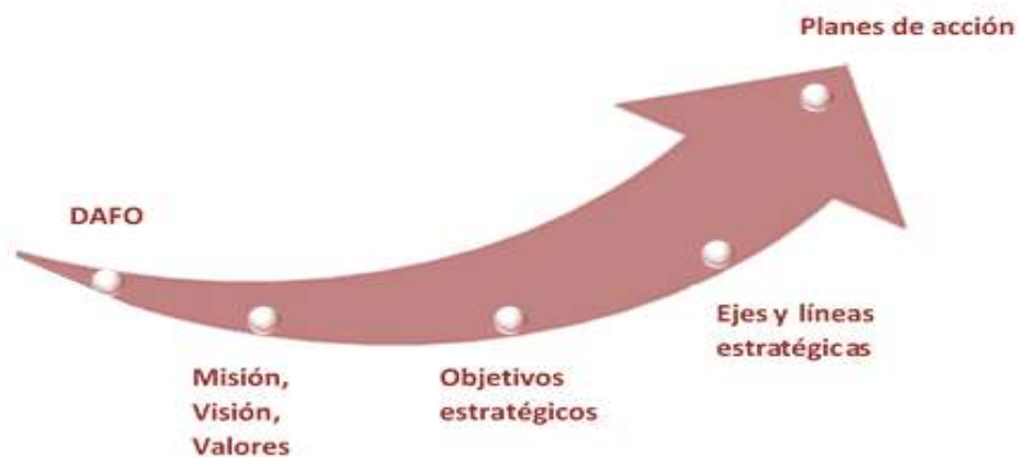
Figura 2. Desarrollo estratégico.

Con el DAFO realizado se definirán finalmente la misión, visión y valores del IdISBa, así como los objetivos estratégicos, ejes y líneas estratégicas, sobre los que se desplegarán los planes de acciones específicos.