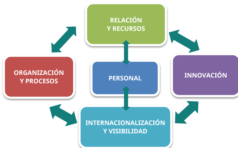
Figura 3. Ejes estratégicos.

Los ejes estratégicos sustentan todos los planes de acción propuestos para el IdISBa en los próximos 4 años. Concretamente, los ejes estratégicos definidos marcan como propósito establecer actuaciones orientadas a consolidar el Instituto a nivel de personal, organizativo, de relación y recursos, de innovación, así como el de internacionalización y visibilidad.