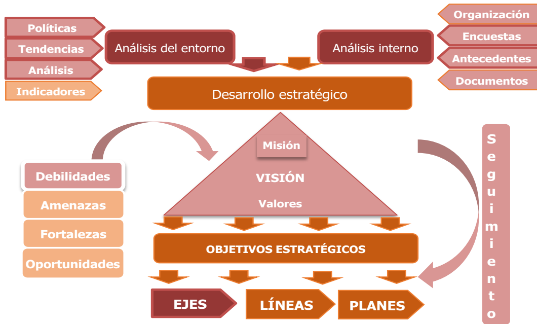
Figura 1. Metodología de elaboración del plan estratégico 2021-2024.